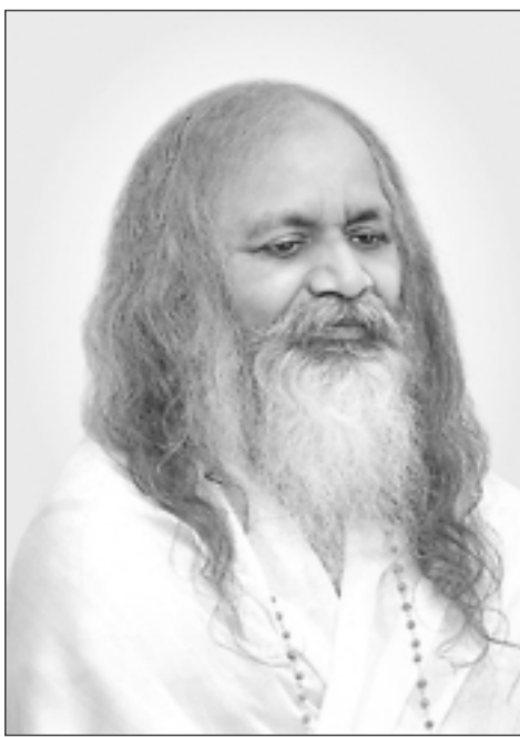
Maharishi Mahesh Yogi, der vor 44 Jahren die Transzendente Meditation in der Welt einführte und Millionen von Menschen Erleuchtung brachte, setzt jetzt das Wissen um das vollständige Naturgesetz für die Unbesiegbarkeit jeder Nation ein.

Ein Angebot an alle Politiker, Wirtschaftsführer und friedliebenden Bürger Deutschlands